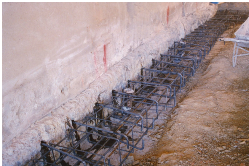
Figura 3: collegamento chimico fondazione esistente cordolo pali