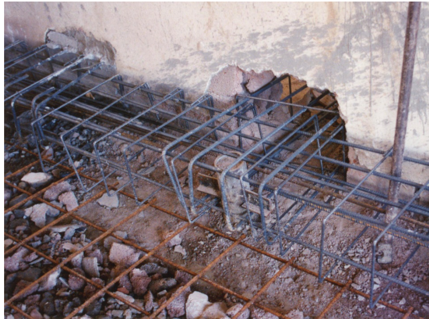
Figura 1: collegamento passante sul micropali (ancoraggio micropali)