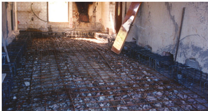
Figura 2: armatura inferiore platea