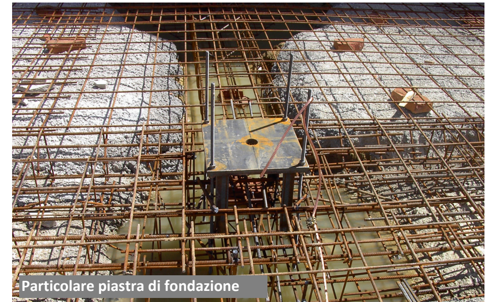
Particolare piastra di fondazione