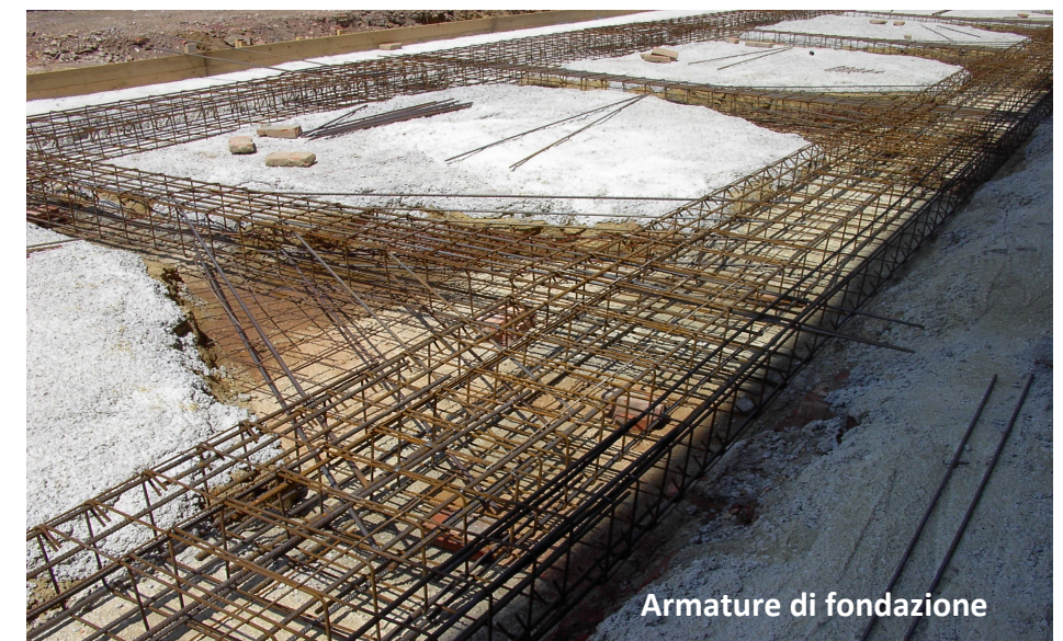
Armature di fondazione